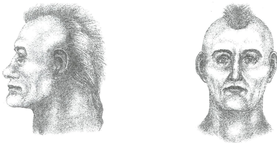
Рис. 2. Реконструкция облика мужчины по черепу из ящика №5 могильника Енбек-Суйгуш.