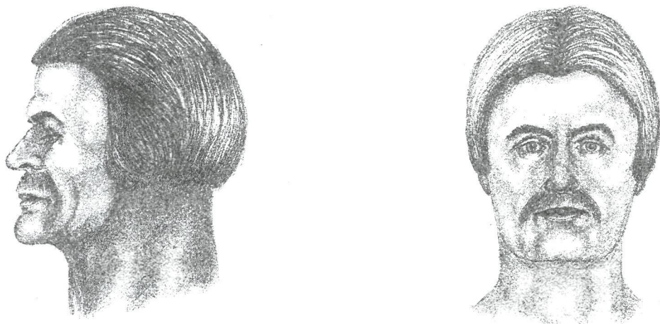
Рис. 1. Реконструкция облика мужчины по черепу из ящика №2 могильника Енбек-Суйгуш.

человека. У восточной стенки был найден фрагмент сосуда темного цвета. На глубине ...см, ближе к северной стенке почти целый сосуд кирпичного цвета, на боках которого вместо орнамента были краской нанесены черные круглые пятнышки. Сосуд имел высоту 11 см. Диаметр 12 см, шаровидной формы. В юго-западном углу на глубине в 87 см был найден череп человека без нижней челюсти, хорошей сохранности. Могила оказалась грабленой, вещей не было. Согласно обмеру, ящик имел в длину 2 метра 3 см, в ширину 105 см. Высота стенок ящика соответственно 126-107-107-105 [см]» 6 .